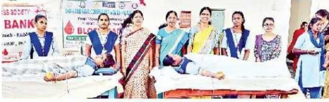
రక్తదానం చేస్తున్న విద్యార్థినులు