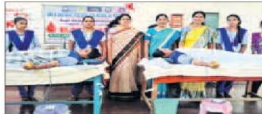
మహిళా డిగ్రీ కళాశాలలో రక్తదానం చేస్తున్న విద్యార్థినులు